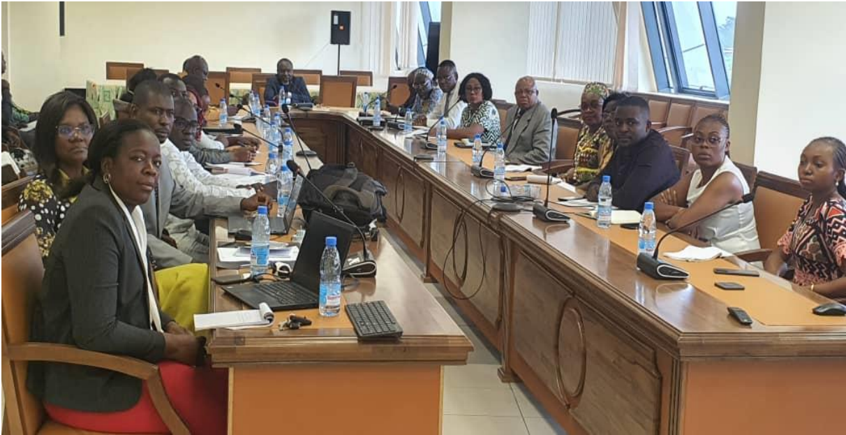
Photo de la deuxième salle de réunion