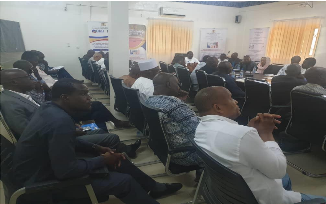
Photo de la deuxième salle de réunion